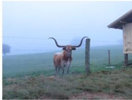
Concurso Fotos - IV CBRG 2º Lugar - Foto: Nathalia Hack Moreira