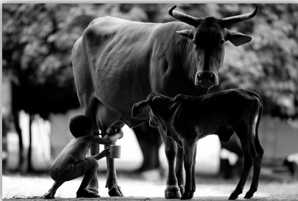
Concurso Fotos - IV CBRG - 1º Lugar

Abaixo segue as fotos dos 5 primeiros colocados.