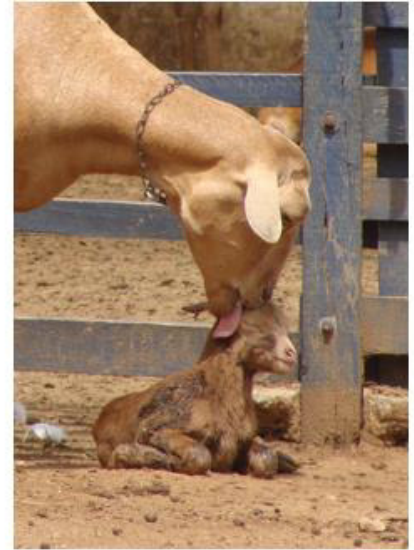
Concurso Fotos - IV CBRG 3º Lugar