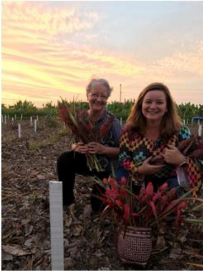
Concurso Fotos - IV CBRG 2º Lugar - Foto: Fernanda Vidigal D. Souza