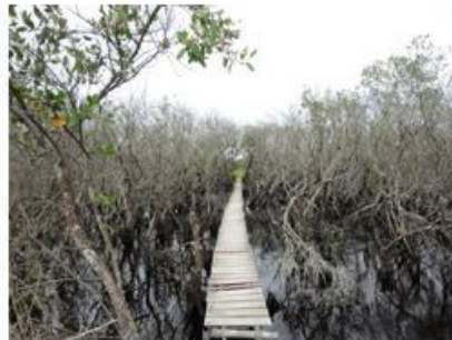
Concurso Fotos - IV CBRG 4º Lugar - Foto: Amanda Pacheco Cardoso Moura