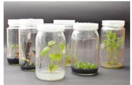
Concurso Fotos - IV CBRG 5º Lugar

Os primeiros colocados na categoria vídeos foram: